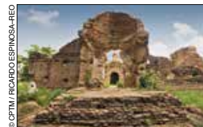
Misión de San Ignacio de Loyola, Pueblo Viejo.

Es el centro de la región agrícola más productiva del estado; aquí se construyó en 1901 la primera fuente de irrigación del noroeste: el Canal El Burrión . En el centro se pueden visitar el Templo de Nuestra Señora del Rosario y el Auditorio Municipal Héroes de Sinaloa . Cuenta con atractivos naturales como las presas Gustavo Díaz Ordaz y Guillermo Blake , y el Sistema Lagunario Navachiste , uno de los ecosistemas con mayor riqueza florística. En las cercanías se encuentran las ruinas de la antigua misión de San Ignacio de Loyola , en Pueblo Viejo , y la antigua misión inconclusa de San Ignacio de Loyola , en Nío .