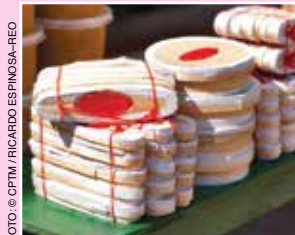
Quesos de El Quielite.

coricos , pinturitas , tamal de frijol , tamal de elote y tamales “tontos” , entre otros. La famosa comida de la costa incluye camarones en aguachile , tacos gobernador , pescado zarandeado , tamales barbones y mariscos frescos .