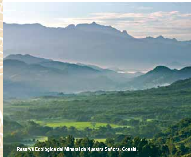
Reserva Ecológica del Mineral de Nuestra Señora, Cosalá.