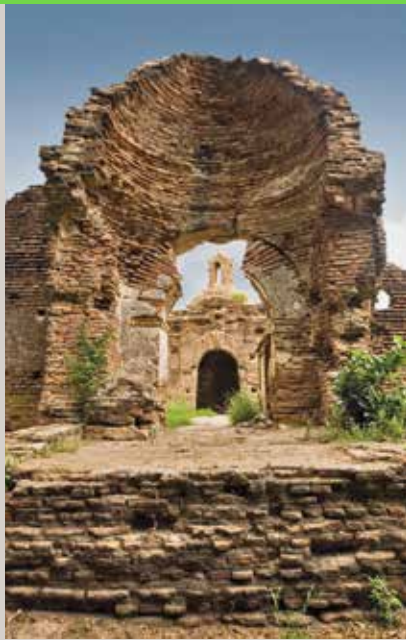
PORTADA: OLAFUR ELIASSON, THE FLOWER ARCHWAY, JARDÍN BOTÁNICO CULIACÁN. CONTRAPORTADA: MISIÓN DE SAN IGNACIO DE LOYOLA, PUEBLO VIEJO.

Secretario Técnico Lic. Raúl Arenzana Olvera