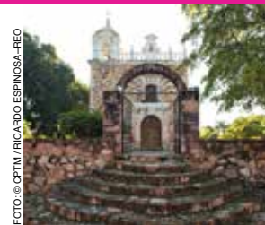
Templo Parroquial del Sagrado Corazón de Jesús, El Fuerte.

Fundada en 1903, es llamada la “puerta al Cañón del Cobre”. Tiene atractivos como la Plaza 27 de Septiembre , el Templo Parroquial del Sagrado Corazón , el Museo Regional del Valle del Fuerte , la Casa de Cultura Profr.