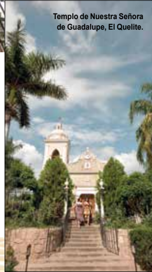
Templo de Nuestra Señora de Guadalupe, El Quelite.

Este poblado colonial, con monumentos como el Templo de Nuestra Señora de Guadalupe , es ideal para realizar el llamado turismo rural y es famoso por sus quesos.