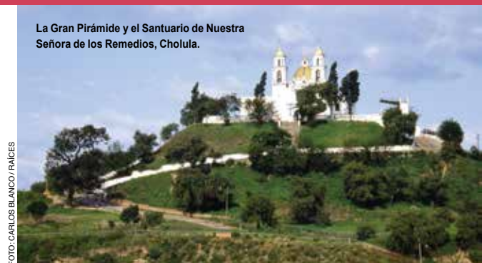
La Gran Pirámide y el Santuario de Nuestra Señora de los Remedios, Cholula.

En este pueblo se encuentra el Templo de San Diego y el Ex Convento de San Miguel , uno de los primeros que se construyeron en América. Es considerado patrimonio cultural de la humanidad y ahora alberga al Museo de la Evangelización .