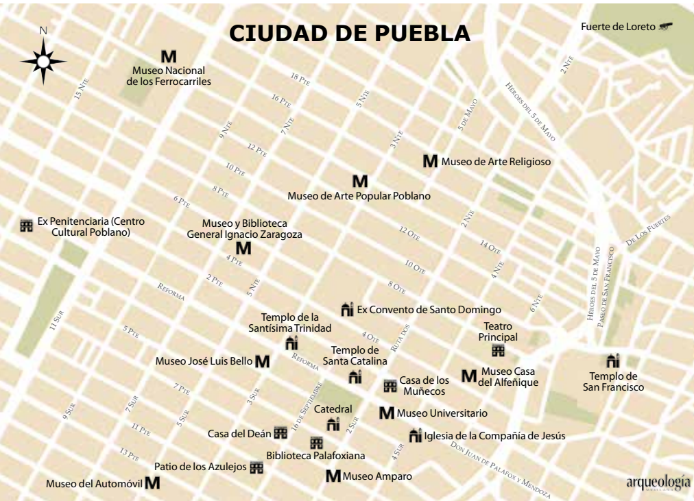
Casa de los Muñecos, Puebla.