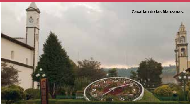
Zacatlán de las Manzanas.