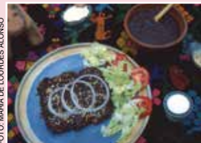
Enchiladas de mole.