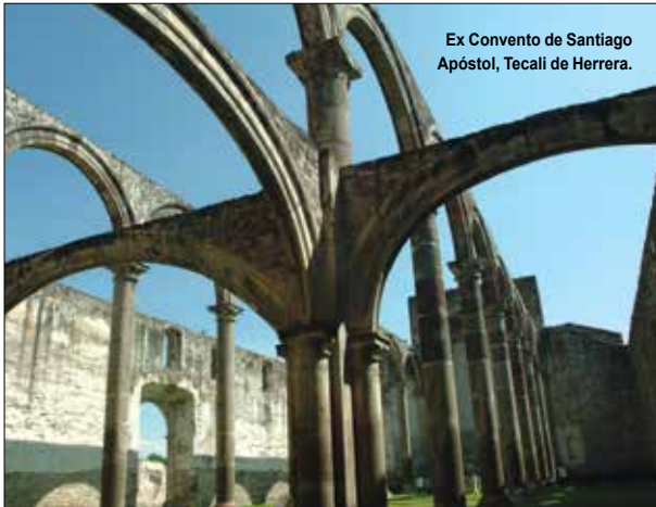
Ex Convento de Santiago Apóstol, Tecali de Herrera.

En esta ciudad, en la que Hernán Cortés estableció el primer ayunta-