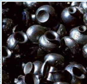
Cerámica de San Bartolo Coyotepec.