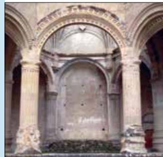
Convento de San Pedro y San Pablo, Teposcolula.

Esta población fue la sede de la Vicaría de la Mixteca , y el Ex Convento de Santo Domingo fue una de las fundaciones dominicas del siglo XVI más sobresalientes.