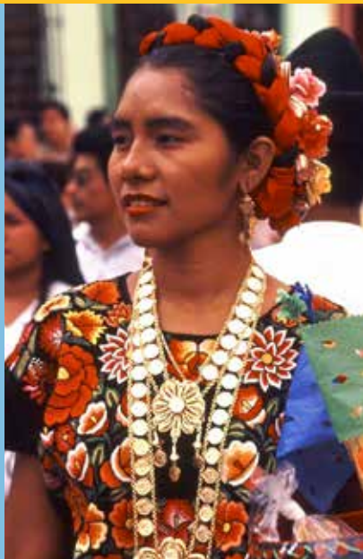
PORTADA: EX CONVENTO DE SANTO DOMINGO DE GUZMÁN. FOTO: GERARDO GONZALEZ RUL / RAÍCES. CONTRAPORTADA: JUCHITECA. FOTO: GUILLERMO ALDANA / RAÍCES