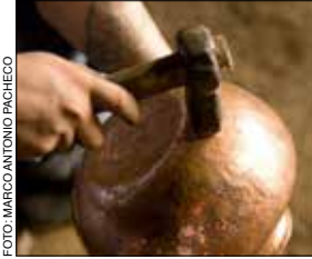
Artesano. Santa Clara del Cobre.

Desde la época prehispánica, Michoacán fue un territorio reconocido por la maestría de sus artesanos. Cabe destacar las lacas , como las de Pátzcuaro, de las pocas regiones en que se mantiene el uso de esta técnica. Otras artesanías son el cobre martillado de Santa Clara del Cobre; los productos de piel de Apatzingán; el vidrio soplado y las esferas navideñas de Tlalpujahua, y las guitarras de Paracho. En distintas poblaciones se trabaja orfebrería , talla de madera , lapidaria , textiles , alfarería y cestería .