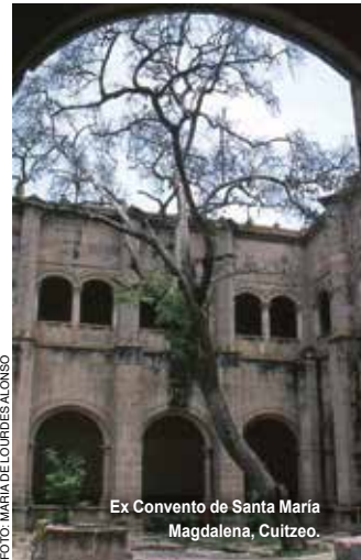
Ex Convento de Santa María Magdalena, Cuitzeo.

Es considerado pueblo mágico por su belleza natural, su atmósfera típica y sus monumentos coloniales. Aquí se encuentra el Ex Convento de Santa María Magdalena , considerado el más bello de los conventos de Michoacán por su estilo plateresco, fundado en 1550 por frailes agustinos. Otros puntos de interés son los templos del Hospital Franciscano , de la Concepción , de San Pablo y del Calvario .