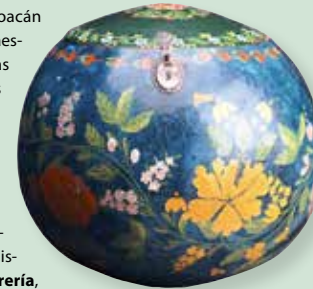
Jícara laqueada. Uruapan. MNA.

Son dos de las principales ciudades del reino tarasco que dominó Michoacán durante el Posclásico Tardío (1200-1521 d.C.). Ihuatzio compartió en algún momento el poder con Pátzcuaro y Tzintzuntzan y es una ciudad de buen tamaño con grandes edificios y calzadas. Tzintzuntzan fue desde alrededor de 1450 d.C. y hasta la conquista española la capital del reino. Tenía un centro ceremonial de buenas proporciones, cuyos edificios principales muestran la distintiva forma arquitectónica conocida como yácata . Otros sitios abiertos al público son Huandacareo , La Nopalería y Tres Cerros –ambos en las orillas del Lago de Cuitzeo – y Tingambato , sitio del Clásico Temprano (200-600 d.-C.) con arquitectura de tipo teotihuacano.