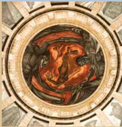
PORTADA: PAISAJE DE MONTAÑA. CONTRAPORTADA: HOSPICIO CABAÑAS.

Cámara Nacional de la Industria de Restaurantes y Alimentos Condimentados (canirac) Puerto Vallarta: Nicaragua, núm. 148, interior 3, Col. 5 de Diciembre, C.P. 48350, Puerto Vallarta, 332-222-3606, presidencia@caniracvallarta.com