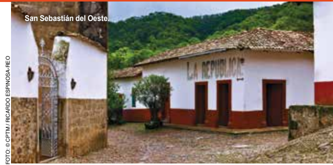
San Sebastián del Oeste