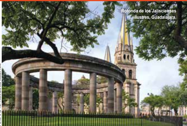
Rotonda de los Jaliscienses Ilustres, Guadalajara.

en la que se encuentra el Hospicio Cabañas . Este edificio –diseñado por el arquitecto Manuel Tolsá y que alberga el mural El hombre de fuego de José Clemente Orozco– ha sido