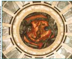
Hospicio Cabañas, Guadalajara.

considerado patrimonio cultural de la humanidad. En el Palacio de Gobierno también se resguardan murales de Orozco y entre los museos de la ciudad destacan el Museo de Arqueología del Occidente de México , el Museo del Periodismo y las Artes Gráficas , el Museo de la Ciudad y el Museo Regional de Guadalajara . En el Mercado de San Juan de Dios se puede encontrar todo tipo de artesanías y artículos varios. Entre los atractivos naturales de la ciudad están el Bosque La Primavera y el Zoológico , ubicado en la Barranca de Huentitán .