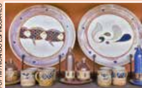
Cerámica de Tlaquepaque.

La artesanía de Jalisco se distingue por la variedad de materiales y técnicas, como el papel maché , los bordados , la platería y el hierro forjado . Sin duda un lugar destacado lo ocupan la loza vidriada y la cerámica bruñida de Tonalá. Son de mencionar también la talabartería de Ciudad Guzmán y Lagos de Moreno; los arcones y las mesas de Jalostotlán; las flores y miniaturas de chitle (especie de látex) de Talpa; los equipales (sillones de bejuco y cuero) de Zacualco de Torres; los piteados de Colotlán; la alfarería , el vidrio soplado y la cerámica de Tlaquepaque.