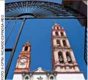
Valle de Santiago.