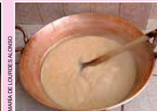
Dulce de leche, Celaya.

obleas , jamoncillos , alfeñiques y rompope , además de las trompadas , muéganos , charamuscas , nieves de pasta de Salamanca y fresas cristalizadas de Irapuato. Entre los platillos más populares están las gorditas de tierras negras (de maíz rellenas de migajas, es decir, de carnicitas de cerdo, queso y chile guajillo), las enchiladas con pata de puerco, los encurtidos , el menudo y las guacamayas (torta de chicharrón y cueritos en salsa de jitomate). Las bebidas más representativas son el colonche (fermentado de tuna roja) y el pulque .