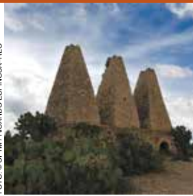
Chimeneas de hacienda. Mineral de Pozos

de interés como la Iglesia de Nuestra Señora de Guadalupe , el Santuario de Guadalupe , los templos del Hospital de San Francisco , de la Soledad , de San Antonio y Expiatorio o de la Promesa , así como las Tres Ermitas . Otros atractivos son el Museo Local , el Museo Fray Bernardo Padilla , el Acueducto , una de las primeras obras de ingeniería de la época colonial y el Puente de Piedra , construcción de 1751. Cuenta con fascinantes sitios como las aguas termales de Chamécuaro , y la Presa Solís .