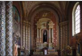
Catedral Basílica de la Luz, León.

Fundada en 1562, ofrece al visitante lugares como la Parroquia de San Felipe Apóstol , la de San Miguel Arcángel , el Templo de la Virgen de la Soledad , el Museo Casa Hidalgo (la Francia Chiquita) y la Plaza Principal . Rodeada de atractivos naturales, se recomienda pasear por el Bosque de Vergel de la Sierra , la cañada Los Panales y la Hacienda La Quemada . En la localidad de Jaral de Berrios se encuentra la Hacienda San Diego del Jaral de Berrios , la más espectacular de la región.