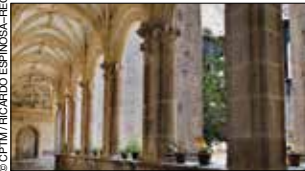
Ex Convento de San Agustín. Yuriria.