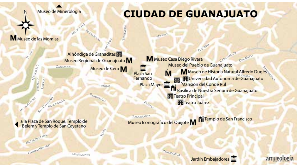
Túnel Miguel Hidalgo, Guanajuato.