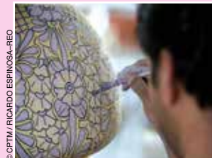
Ceramista, Dolores Hidalgo.

La cocina guanajuatense se caracteriza sobre todo por los dulces de leche: cajetas ,