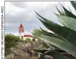
Mineral de Pozos.

Esta histórica ciudad –en 1810 fue declarada cuartel general del Ejército Grande de América, y Miguel Hidalgo fue nombrado Generalísimo de las Américas– tiene puntos