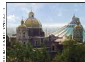
La Villa, Gustavo A. Madero.

Delegación famosa por la celebración de la Semana Santa realizada en el Cerro de la Estrella . Entre sus principales atractivos se encuentran el Parque Nacional Cerro de la Estrella –el cual alberga a la Pirámide y Museo Arqueológico del Fuego Nuevo –, el Museo de las Culturas Pasión por Iztapalapa , la Parroquia de San Juan Bautista , la Parroquia de Santiago Acahualtepec , el Santuario