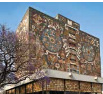
Ciudad Universitaria, Coyoacán.

Aquí se recomienda visitar el Jardín Centenario y la Plaza Hidalgo , el Templo y Ex Convento de San Juan Bautista , el barrio de Santa Catalina , la Casa de la Cultura Jesús Reyes Heróles , la Plaza de la Conchita , el Museo Casa Azul Frida Kahlo , el Museo Nacional de Culturas Populares , el Museo Nacional de las Intervenciones , el Museo Casa León Trotsky , la Fonoteca Nacional , el Museo Escultórico Geles Cabrera , el Museo Nacional de la Acuarela , el Centro Nacional de las Artes , el Museo de las Artes Gráficas , el Parque Nacional Viveros de Coyoacán y la Capilla de San Antonio Panzacola . Otros puntos de interés, fuera del centro de Coyoacán, son el Museo Diego Rivera Anahuacalli , el Museo del Automóvil , el Museo Histórico Naval , la Cineteca Nacional y el Estadio Azteca , así como las zonas naturales Parque Ecológico Los Coyotes , Parque Ecológico y Deportivo Huayamilpas y la Reserva Ecológica del Pedregal de San Ángel . Un atractivo de especial relevancia en esta delegación es la Ciudad Universitaria , considerada patrimonio cultural de la humanidad.