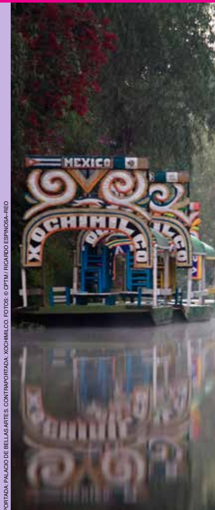
PORTADA: PALACIO DE BELLAS ARTES. CONTRAPORTADA: XOCHIMILCO.

Secretario Técnico Lic. Raúl Arenzana Olvera