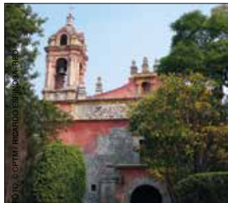
Iglesia de San Jacinto, San Ángel, Álvaro Obregón.

Su principal atractivo es el Parque Nacional Desierto de los Leones , que alberga al Centro Cultural Ex Convento Santo Desierto de Nuestra Señora del Carmen y al Museo Zapata . En el centro se encuentran el Jardín Hidalgo , el Foro Pedro Infante y la Parroquia de San Pedro Apóstol .