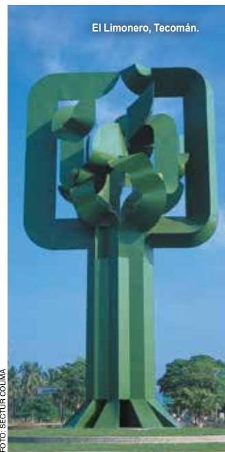
El Limonero, Tecomán.

En este pequeño pueblo se elabora una distintiva artesanía pintada de rojo. Entre sus atractivos están la Iglesia de la Inmaculada Concepción ; El Salto , cascada con una caída de 20 m; Ojo de Mar , una laguna circular, y el Cerro La Astilla , con una mina de hierro.