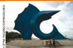
Escultura de pez vela, Manzanillo.