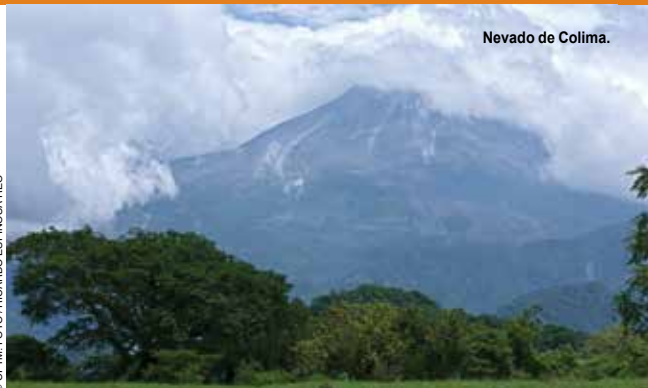
Nevado de Colima.