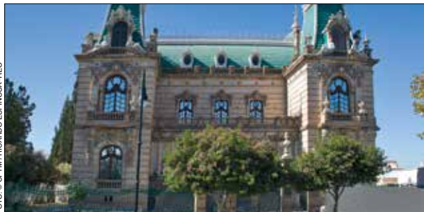
Centro Cultural Universitario Quinta Gameros.

Otros puntos de interés son el Palacio de Gobierno que también alberga al Museo de Hidalgo ; el Palacio Municipal ; el Museo de la Revolución Mexicana , igualmente conocido como Casa de Villa o Quinta Luz ; el Museo de la Lealtad Republicana Casa Juárez ; el Centro Cultural Universitario Quinta Gameros , un edificio de estilo neoclásico con detalles rococó y art nouveau ; el Museo