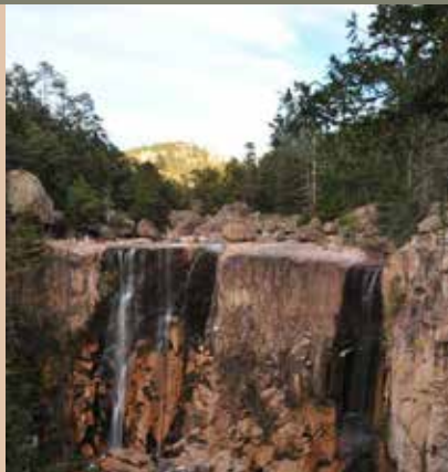
PORTADA: PAQUIMÉ. CONTRAPORTADA: CASCADA DE CUSARARE.

Cámara Nacional de la Industria de Restaurantes y Alimentos Condimentados (canirac): Chihuahua. Teófilo Borunda, núm. 803 A, Col. Mirador, C.P. 31270, Chihuahua, Chih., 614-410-8712 y 201-0294, gerencia@caniracchihuahua.org; www.caniracchihuahua.org