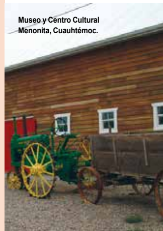
Museo y Centro Cultural Menonita, Cuauhtémoc.

Aquí se encuentra la comunidad menonita más grande del país. Es una población que se distingue por la producción de manzana y queso menonita. Tiene atractivos como la Catedral , la Capilla de Dolores y del Rosario , el Templo de San Andrés , la Plaza Central y el Museo y Centro Cultural Menonita . Cuenta con bellezas naturales como el Cañón de Namurachi y el Cañón del Maíz .