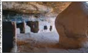
Cueva de la Olla.

Se pueden admirar la Catedral , la Estación de Ferrocarril y campes menonitas como el del Capulín , la Colonia Dublán , un asentamiento mormón, y la Laguna Rodolfo Fierro .