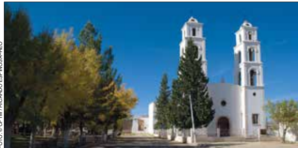
Parroquia de San Antonio de Padua, Casas Grandes.