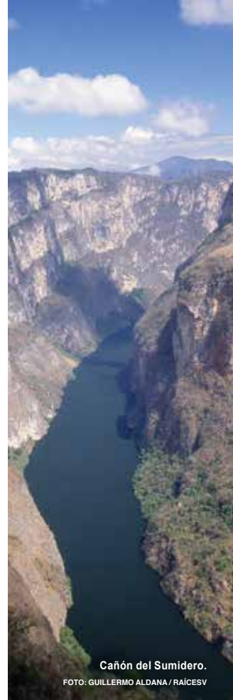
Cañón del Sumidero.

Imponente formación natural, cuyas paredes alcanzan los 800 m de altura. Al fondo del cañón fluye el caudaloso río Grijalva , en medio de una exuberante vegetación. Al recorrerlo en lancha se pueden observar cascadas, cuevas y una enorme diversidad de especies de aves y reptiles.